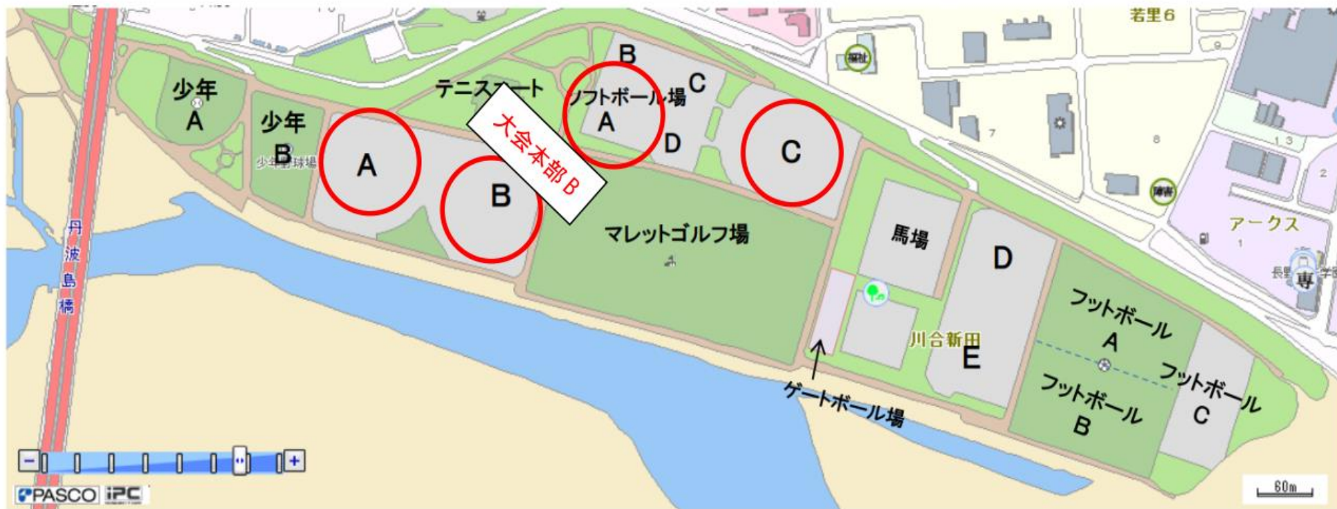
犀川第二運動場 配置図